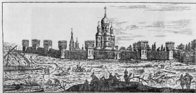
Древній видъ Донского монастыря (съ Шабоваго). Съ гравюры Пикара (до 1714 г.) въ Московскомъ Историческомъ Музеѣ.

видѣ группы высокихъ столбовъ, увѣнчанныхъ главами; избѣгалъ прямыхъ угловъ, обращая ихъ въ тупые или въ закругленія; украшалъ широкия окна колоннами, перевязанными сверху и снизу карнизами и покрывалъ ихъ фронтонами, образованными не изъ однихъ только прямыхъ, но и изъ кривыхъ линий. Такъ именно и построенъ соборъ Донского монастыря. Необходимо при сужденіи объ архитектурѣ собора имѣть въ виду, что современная коническая кровля собора сдѣлана позднѣе. Первоначально каждый изъ пяти куполовъ собора имѣлъ особую для себя крышу, что