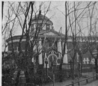
Михаило-Архангельская церковь. Съезд фотос. С. Доброунова.

Теперьшняя внутренняя отделка храма произведена в 1895—6 гг. Храм расписан орнаментами и священными изображениями на масле; эти изображения выполнены в стиле XVI—XVII в. Иконостас имеет вид портика с колонками в классическом стиле. Арки на верку иконостаса составляют позднейшую прибавку. Иконостас, прежде белый с позолотой, ныне весь вызолочен. Иконы в иконостасе художественного письма. В прочих местах храма размещены иконы частью прежде находившиеся в храме, частью поставленные в нем вновь при ремонте 1895—6 г. По художественности исполнения выделяются несколько икон из жизни Алексия, человека Божия.