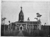
Кладбищенская церковь.

Внутренность храма окрашена въ зеленовато-голубой цвѣтъ. Въ храмѣ—уже сдѣлана солея и амвоны для трехъ престоловъ и сооружены три изящныхъ иконостаса изъ бѣлаго фарфора съ золотой отдѣлкой. Иконы въ иконостасахъ писаны въ стилѣ XVI—XVII в.в. въ иконописной палатѣ при Московской Синодальной Канторѣ. Престолы предположено освятить: въ честь сошествія во адъ и Воскресенія Христова—лѣвый, правый—въ честь Успенія Божіей Матери и средней—во имя преподобнаго Серафима Саровскаго.