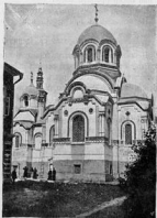
Іоанно-Златоустовская и Екатерининская церкви.

Въ нижнемъ храмѣ во имя св. мученицы Екатерины уже совершается Богослужение. Храмъ не отличается помѣстительностью. Одна вѣтъ его плановаго креста занята алтаремъ, другая—дѣлтицей въ верхній храмъ,