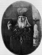
Архимандритъ Теофанъ, церковный композиторъ. Съ портрета, принадлежавшаго Донскому духовному училищу.

Цѣлью музыкальнаго образованія Теофана поставлено было то, чтобы научить его переложать древніе церковныя пѣнія на 4 голоса. Теофанъ не только приобрѣлъ навыкъ къ переложеніямъ, но обнаружилъ и развилъ въ себѣ способность къ самостоятельнымъ музыкальнымъ сочиненіямъ. Переложенія Теофана обнимаютъ почти весь кругъ церковнаго русскаго пѣнія. Сравнительно мало написано имъ самостоятельныхъ сочиненій. Всѣ музыкальныя произведенія Теофана отличаются церковнымъ духомъ, правдивы по постановкѣ удареній на словахъ и по пунктуации, часто отличаются выразительностью музыки и, если иногда допускаютъ ошибки противъ теоріи гармоніи (параллельныя квинты и октавы, напр.), то противъ теоріи въ томъ видѣ, въ какомъ она разработана и принята лишь въ настоящее время. Богослуженіе въ Донскомъ монастырь при Теофанѣ, за кото-