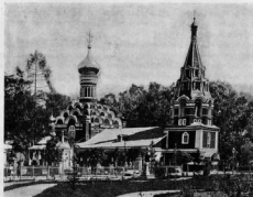
Первоначальный храмъ вѣ честь Донской иконы Божией Матери въ Донскомъ монастырь.

и начался Донской монастырь. Храмъ этотъ занимаетъ мѣсто, гдѣ, во время нашествя на Москву крымскихъ татаръ, стояла полотняная походная церковь во имя преп. Сергия Радонежскаго чудотворца, а въ ней—Донской образъ Божией Матери, бывший на Куликовомъ полѣ и подъ стѣнами Казани.