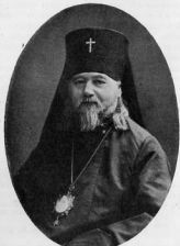
Членъ Св. Синода, Высокопреосвященнѣйшій архіеп. Алексій, управляющій Донскимъ монастыремъ.

Въ управленіе Донскихъ монастыремъ Высокопреосвященнѣйшаго арх. Алексія, при поддержкѣ въ монастырѣ распоряженіями и личнымъ примѣромъ самого владыки добрыхъ христіанскихъ отношеній, выполненія монастырскаго иерконнаго уставовъ и благодѣлія въ церковномъ богослуженіи; Донской монастырь приведенъ (и приводится) въ благоустройство и съ вѣшной стороны. Такъ отреставрированы и окрашены ограда и башня вокругъ монастыря, Тихвинская церковь, часовня, колокольня и соборъ. Въ соборѣ очищена отъ пыли и коפותи живопись Екатерининской эпохи;