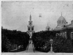
Тихвинская церковь. Настоятельскій домъ. (Видъ внутри монастыря. Справа летитъ аэропланъ).

Нижняя часть храма Тихвинской иконы Божіей Матери — ворота — въ современномъ видѣ построены въ 1693 году изъ матеріаловъ и въ стилѣ