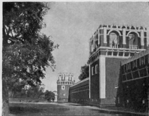
Часть ограды сь западной стороны.

В настоящее время монастырь окружаютъ двѣ ограды: а) древняя, окружающая т. н. старый монастырь, и б) новая, окружающая новое монастырское кладбище сь храмомъ на немъ. Площадь, обнимаемая этими оградями, имѣетъ покатысь на востокъ, въ сторону улицы Шаболовки. Западная часть этой площади отличается сухостью грунта; вода здѣсь начинается на 10—11 саженой глубинѣ. Восточная часть описываемой площади содержитъ вь себѣ воду на значительно меньшей глубинѣ. Это обстоятельство объясняетъ, почему вь юго-восточномъ углу монастыря вь