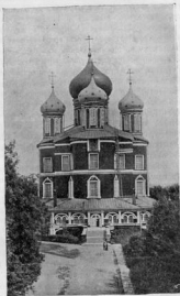
Соборъ въ честь Донской иконы Божіей Матери.

Въ планѣ своею соборъ представляетъ равноконечный крестъ. Въ углахъ между вѣтвями этого креста имѣются выступы, придающіе кресту какъ бы снѣгъ. Такой планъ былъ тогда новостью въ церковно-строительномъ дѣлѣ. По крестовому плану впервые началъ строить Новоіерусалимскій соборъ Воскресенія Христова патріархъ Никонъ, руководившійся моделями, привезенными изъ стараго Іерусалима Арсѣмѣемъ Сухановымъ. Готовые образцы храмовъ, построенныхъ на крестовомъ основаніи, имѣлись въ Малороссіи, тогда только что присоединенной къ Великоороссіи. Храмъ Гроба Господня въ Старомъ Іерусалимѣ, какъ извѣстно, окруженъ пристройками, вслѣдствіе чего фасадъ его неизвѣстенъ. Образцы фасадомъ для храмовъ съ крестатымъ планомъ дала Малороссія, въ которой господствовала стили барокко. Этотъ стиль любилъ возводить храмы въ