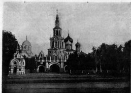
Ц. св. Іоанна Златоуста и вѣст. Екатерины.

Въ 1591 году Крымскій ханъ Казы-Гирей вздумалъ напасть на Москву. Мѣсто для этого нападенія онъ избралъ между Калужской и Серпуховской заставами. Царь Феодоръ Иоанновичъ противопоставилъ хану незначительное