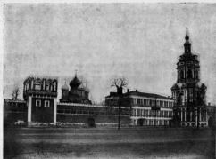
Донское духовное училище.

Въ 1825 г. извѣстный церковный композиторъ архим. Ѳеофанъ, настоятель Донского монастыря, по призыву своего покровителя, митрополита Московскаго Платона, открывшаго Винзавско семинарію, предоставить зданію, гдѣ прежде находился цензурный комитетъ, для помѣщенія Донского духовнаго училища. Даръ архимандрита Ѳеофана принесли обильныя